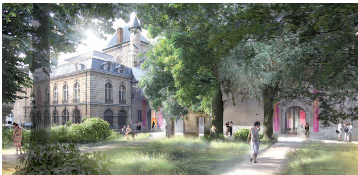
Le musée des Beaux-Arts de Dijon : perspective du square des Ducs, 2005

La partie projet indiquait les grands axes de développement dans les années à venir : enrichissement de la collection, mise en cohérence des collections des musées municipaux, ouverture à l'art contemporain, recherche et diffusion scientifique, politique d'expositions temporaires, manifestations artistiques