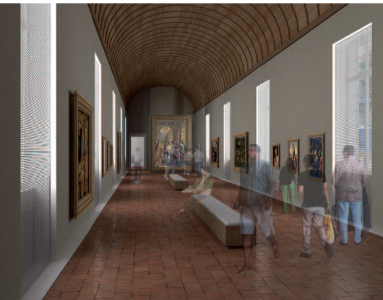
Le musée des Beaux-Arts de Dijon : perspective de la galerie de Bellegarde, 2007 © Ateliers Lion architectes urbanistes

L'année 2006 a été une année importante dans l'évolution des activités culturelles, au-delà des « classiques » visites guidées et ateliers d'arts plastiques. Depuis l'année 2000 s'était prise l'habitude d'accompagner les expositions temporaires de concerts et de lectures en rapport avec leur thème, et d'établir des partenariats avec certaines institutions culturelles dijonnaises. En 2006, de nouveaux rendez-vous ont été mis en place : les visites Musée, ouvre-toi ! et Le musée les yeux fermés , les ateliers Artistes d'un dimanche et À vous de jouer ! , les Actualités de 12 h 30 et les Nocturnes . Les manifestations artistiques s'appuient sur des partenariats réguliers avec les institutions culturelles dijonnaises et avec les festivals et événements culturels qui marquent son