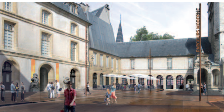
Le musée des Beaux-Arts de Dijon : perspective de la cour de Bar, 2005 © Ateliers Lion architectes urbanistes

Élaboré dès 2001, le Projet Scientifique et Culturel du musée des Beaux-Arts de Dijon a servi de base au lancement du chantier de rénovation de l'établissement. Aujourd'hui, la nécessité d'un nouveau PSC se fait sentir, notamment pour redéfinir les grands axes de développement dans le cadre de la politique culturelle de la municipalité : la responsable du musée décline ici toutes les étapes de l'opération, pointant les adaptations et changements d'orientation.