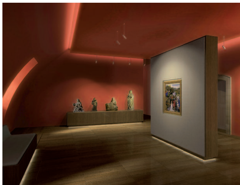
Le musée des Beaux-Arts de Dijon : perspective de la salle du Maître de Flémalle, 2007

Le projet de rénovation ne serait pas complet s'il n'était l'occasion d'une remise à niveau de la collection. La Ville a attribué un terrain au nord de Dijon pour les futures réserves du musée. Un programme technique détaillé a été élaboré en 2005 par le cabinet ID111 (sous la direction de Frédéric Ladonne). Le 26 septembre 2005, le conseil municipal approuva ce PTD et l'enveloppe financière de la construction de nouvelles réserves (4 millions d'euros TTC). À l'issue d'un concours, le Conseil municipal du 15 mai 2006 sélectionna le cabinet Denu et Paradon. Après les études préalables, la construction a commencé à la mi 2008 pour une livraison d'un bâtiment neuf de 2 500 m 2 en mai 2010.