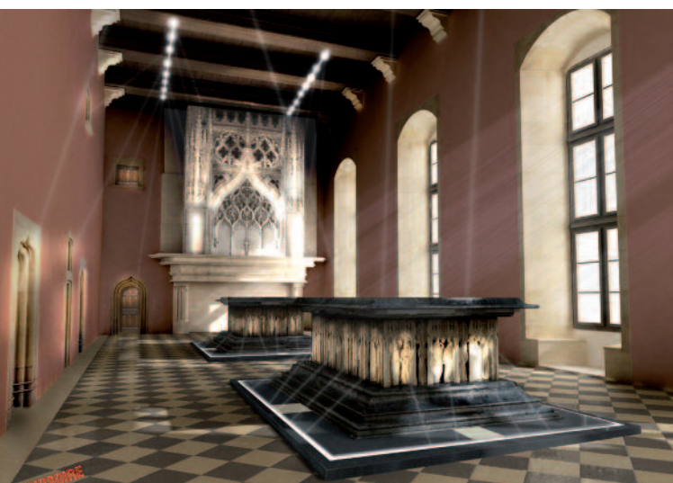
Le musée des Beaux-Arts de Dijon : perspective de la salle des Tombeaux, 2008 © Eric Pallot, architecte en chef des Monuments historiques

En terme de communication, une charte graphique du musée des Beaux-Arts s'est progressivement mise en place depuis 2005, en cohérence avec l'affirmation du positionnement du musée dans la vie culturelle à l'aube de sa rénovation. En mai 2008, le musée a enfin mis en ligne son site Internet : www.mba-dijon.fr . En 2007, les efforts ont porté sur l'orientation et l'accueil des visiteurs, avec un réaménagement de l'accueil et une nouvelle signalétique. Pour la première fois à la fin de 2007, le musée a bénéficié des dispositions de la loi de 2003 sur le mécénat, avec le don par APRR (Autoroutes Paris-Rhin-Rhône) de la statue Louis XIII enfant de François